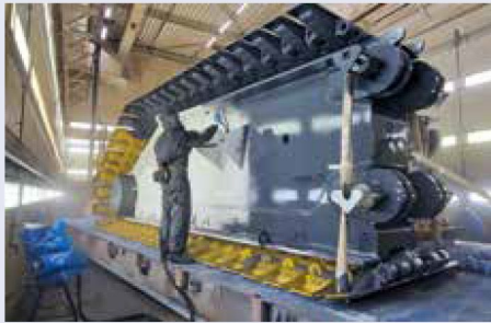
Grundierung des Kettenfahrwerks.