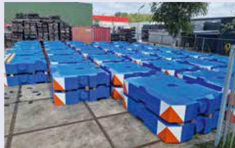
Die frisch lackierten Ballastplatten.