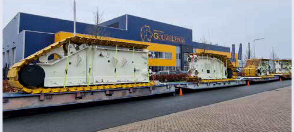
Angeliefert zum Lackieren: das Kettenfahrwerk der CC8800-1.

Das Lackieren von Raupenkranen ist ein Beruf an sich und bei Gouweleeuw hat man mittlerweile über 30 Jahre Erfahrung in dieser Sparte.