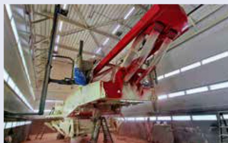
Lackierarbeiten an der Demag CC1500.