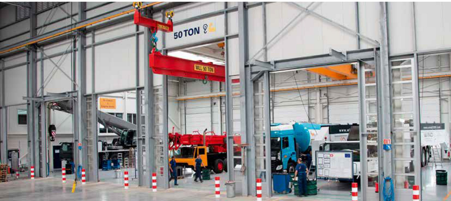
Ein Blick hinter die Tore.