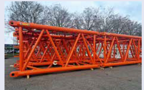
Gittermastkomponenten in neuer Farbe.