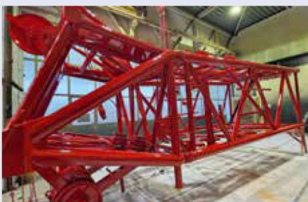
Gittermastkomponente mit roter Lackierung.