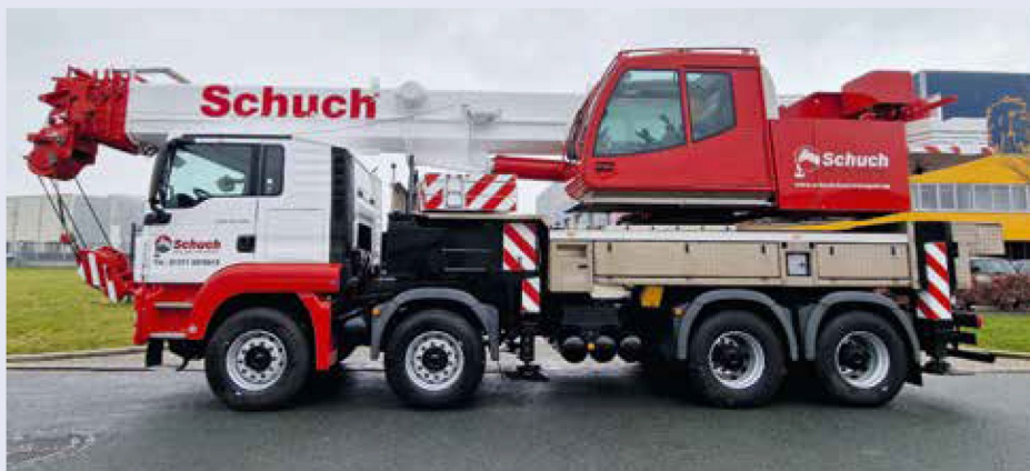
Erstrahlt in neuem Glanz: der fertige Tadano HK 60 von Schuch Krandienst.

Nach der Demontage der abnehmbaren Teile wurde der Kran zunächst einer gründlichen Reinigung unterzogen. Der Waschbereich ist mit Wartungsgrube und Podest ausgestattet, sodass sowohl unten als auch von oben gründlich gereinigt werden kann. Anschließend wurde der Kran geschliffen und die Roststellen vorsichtig mit einem Nadelhammer entfernt. Die festen Teile, die nicht lackiert werden durften, wurden sorgfältig abgeklebt. Danach folgte die Grundierung und anschließend die Lackierung in den Farben von Schuch Krandienst. Die abnehmbaren Teile und Felgen wurden separat gestrahlt und lackiert. Zuletzt wurde der Kran wieder zusammengebaut und mit der Beschriftung versehen.