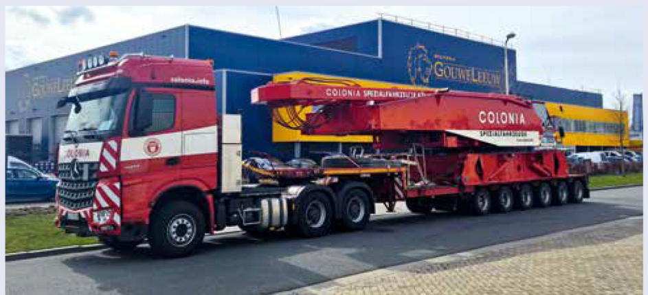
CC1500 – Das Grundgerät erstrahlt im neuen Lack.