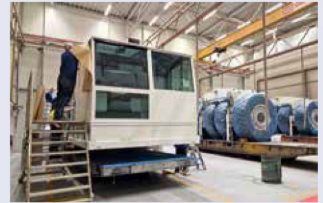
Abkleben der Kranführerkabine.