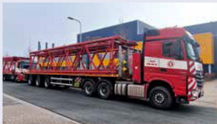
Anlieferung der einzelnen Teile.

Im Auftrag von Colonia Spezialfahrzeuge wurde eine Demag CC1500 in den Firmenfarben lackiert. Auch die komplette Ausrüstung HA 84, HI 84 und Gegengewicht wurde bei Gouweleuu und gestrahlt und lackiert bevor zum Schluss die Beschriftung angebracht wurde.