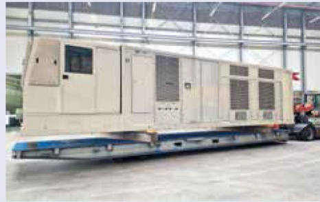
Transport der Kranführerkabine.